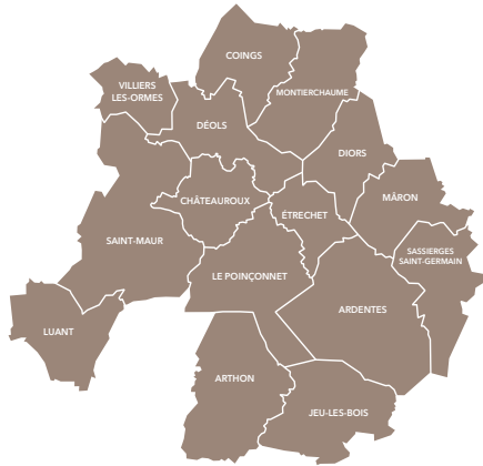
LES 15 COMMUNES DE L'AGGLOMÉRATION

agricoles. Entité administrative consolidée autour de la Ville-centre et de ses 4 pôles d'équilibre, l'organisation du territoire se renforce pas à pas.